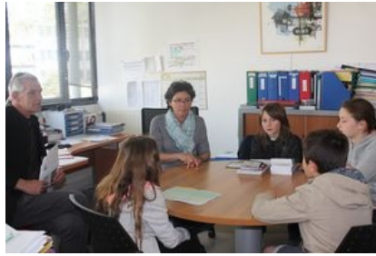
les jeunes élus découvrent les différents événements organisés par le service