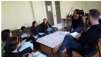
un second groupe visite la direction de la communication, accompagné par un animateur