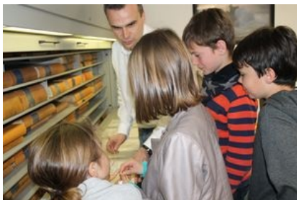
Présentation des registres de naissances, décès ou mariages.

A quoi sert le service état civil ? Est-ce un service obligatoire dans une commune ? C'est à ces questions que les officiers d'états civil ont dû répondre.