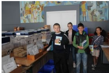
Dans la salle où sont entreposées les urnes