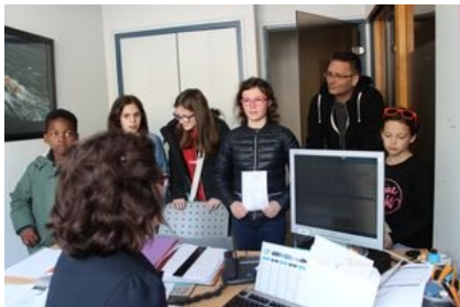
Présentation des démarches pour pouvoir voter

Les prochaines élections présidentielles ont été un bon support pour expliquer les missions du services des élections.