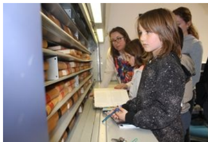
Les élus nés à Lorient ont pu regarder leur acte de naissance.