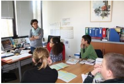
La culture, c'est quoi ?